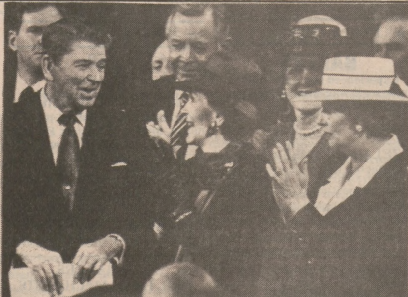
LONDYN — Brytyjska premier Margaret Thatcher, Nancy Reagan (w środku) oraz członkowie brytyjskiego gabinetu zgromadzili przybyli do Londynu burzliwą owację po jego przemówieniu wygłoszonym w londyńskim Guildhall.