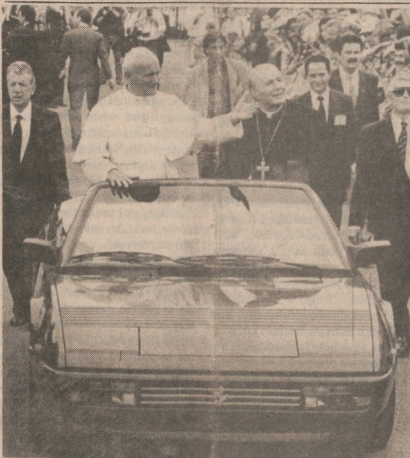
MARANELLO, WŁOCHY. — Na początku czerwca Ojciec Święty odwiedził to miasto. Na zdjęciu Papież w najnowszym modelu Ferrari Mondial Cabriolet przejeżdża po bieżni boiska entuzjastycznie witany przez mieszkańców.