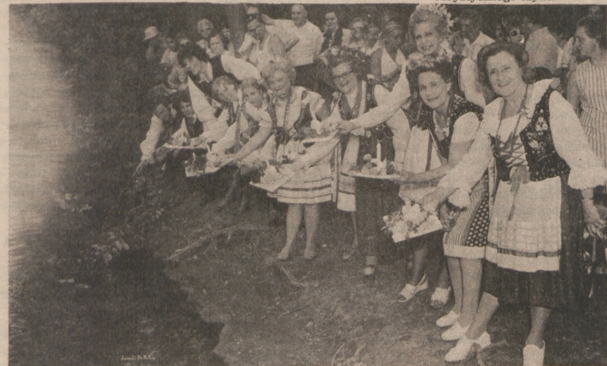
Co roku Legion Młodych Polek urządza tradycyjne, polskie "Świętojanki, podtrzymując tradycje "Sobótki". Na zdjęciu — Panie z Legionu w czasie tradycyjnego puszczania wianków na wodę.