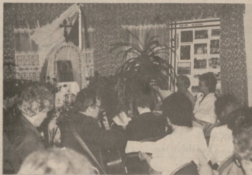
W skupieniu przed obrazem Matki Boskiej.

"Z Dzieckiem Swoim Rozmawiaj Po Polsku i Przekaż Mu Polskie Tradycje"