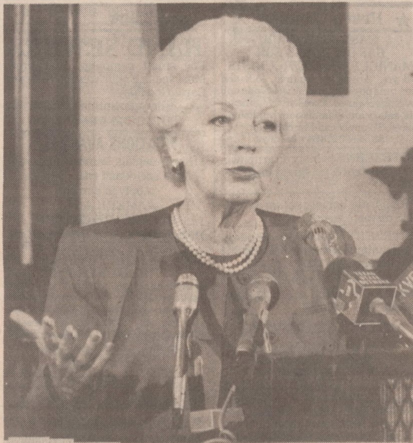
AUSTIN — Ann Richard, skarbnik stanu Teksas wygłosi inauguracyjne przemówienie podczas Konwencji Partii Demokratycznej, która w połowie lipca odbędzie się w Atlancie.

Rząd USA oświadczył wczoraj, że gotów jest wypłacić odszkodowanie rodzinom zmarłych. Może to jednak nastąpić dopiero po zakończeniu dochodzeń specjalnej komisji amerykańskich ekspertów wojskowych, którzy badają okoliczności w jakich doszło do katastrofy.