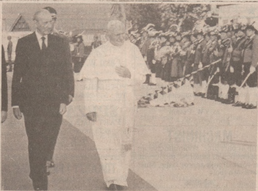
INNSBRUCK — Zakończenie wizyty Ojca Św. w Austrii. W ceremonii pożegnalnej na lotnisku w Innsbrucku wziął udział prezydent tego kraju Kurt Waldheim.