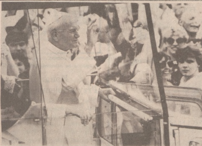
WIENIĘ — Jan Paweł II złożył pięciodniową wizytę duszpasterską w Austrii. Na zdjęciu, przejazd Ojca Św. ulicami Wiednia.

Organizatorzy zapewniają wyśmienite potrawy polskie i amerykańskie do tańca grać będzie zespół "Music Makers".