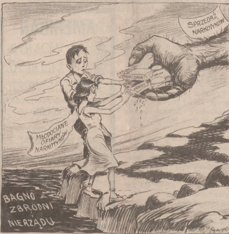
Rysunek ten ukazał się po raz pierwszy w "Dzienniku" w czerwcu 1951 r. z ostrzeżeniem: "Rodzice uważajcie na swe dzieci!". Jak widać nadal jest aktualny.

Dziś, wokół budynków lotniska znów ustawiły się kolumny demonstrantów. Wojsko nie wpuszcza ich jednak na teren lotniczego portu.