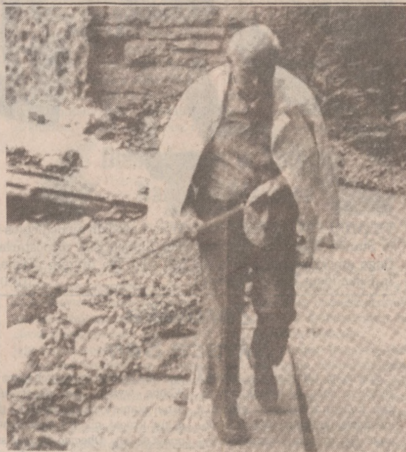
WŁOCHY — Ojciec Święty na spacerze w czasie 10-dniowych wakacji, które spędza w północnych Włoszech. W ubiegły czwartek spacer taki trwał aż 5 godzin. Na zdjęciu Papież przechodzi przez strumień górski kładką położoną przez towarzyszące Mu osoby.

W sumie, bardzo ciekawy mecz podobał się licznie zgromadzonej publiczności.