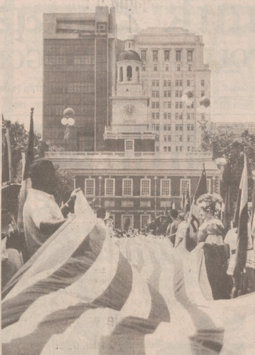
FILADELFINA — Z okazji 212 rocznicy narodzin niepodległości Stanów Zjednoczonych młodzież filadelfijska rozpostarła flagę amerykańską o długości 600 stóp. Na drugim planie, Independence Hall w Filadelfii.

Następujące po sobie okresy "błedności" i "rozżarzania się" słońca zdają się zgadzać z 11-letnim cyklem plam na słońcu.