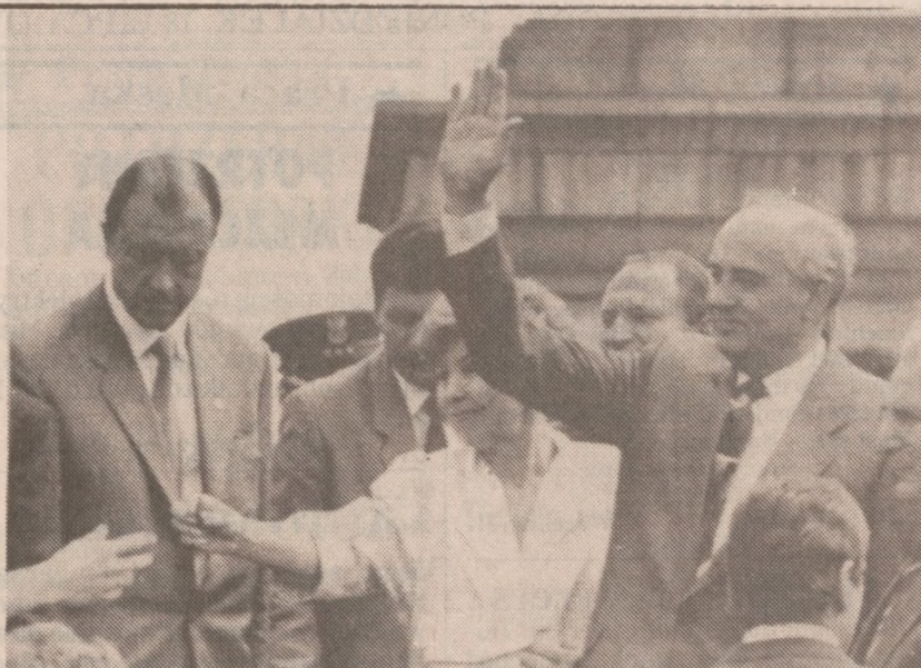
WARSZAWA — Sowiecki przywódca Michaił Gorbaczow wraz z małżonką odwiedził cmentarz żołnierzy sowieckich w Warszawie. Na zdjęciu, Gorbaczow pozdrawia podobno licznie zebranych mieszkańców stolicy.

Policja twierdzi, że większość ofiar podejrzanych to starsze kobiety, obrabowane w drodze do kościoła lub banku.