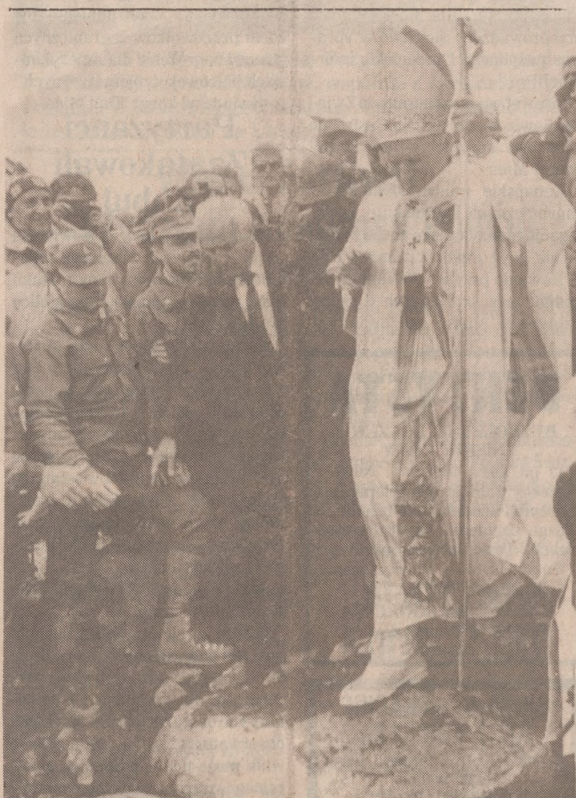
MOUNT ADAMELLO, WŁOCHY—W ubiegłą sobotę, w czasie swego 10-dniowego urlopu spędzanego w górach, Ojciec Święty odprawił Mszę św. na szczyście Adamello w związku z 70-tą rocznicą zakończenia I Wojny Światowej. Na zdjęciu Papież schodzi ze szczytu górskiego po odprawieniu nabożeństwa.

Nadal brak konkretnych ustaleń w sprawie terminu rozpoczęcia odwołania wojsk reżimu Castro na Kubę.