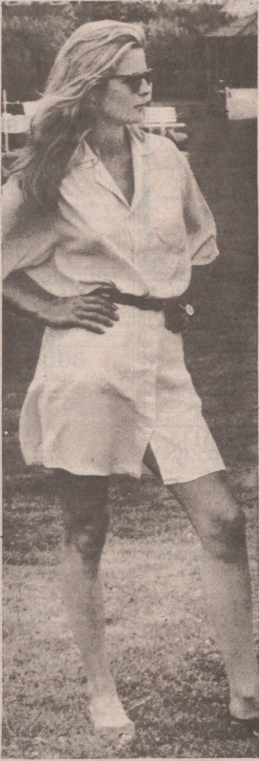
Modna sukienka do gry w tenisa.