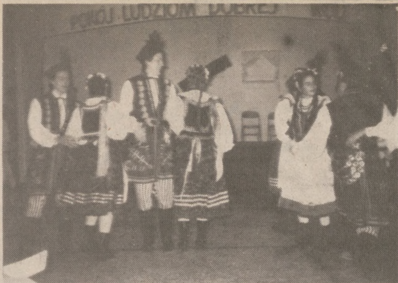
"Lechici" w krakowiaku.

Wprawdzie klęska przyniosła załamanie ducha narodu, zrodziła kierunek pozytywistycznej idei "budowy od podstaw", to jednak szybko wróciła wiara we własne siły i zdolność uzyskania wolności własnymi siłami, czekając znów tylko na odpowiedni moment.