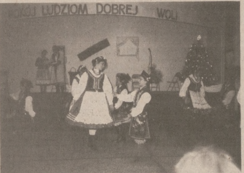
Scenka z "Lechitami".

Przy okazji zarząd K.P.H. wyraża serdeczne podziękowanie społeczeństwu za poparcie naszego sylwestra, podkreślamy przy tym liczny udział młodszej generacji jak również najnowszej emigracji. Miłym nam był również liczny udział rodzin instruktorskich. Jak podkreślali goście zabawa