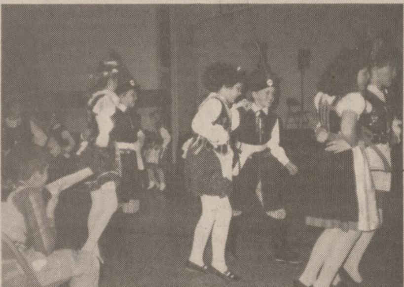
Zespół "Orląt" w tańcu.

Serdecznie zapraszamy. Nasze zabawy taneczne słyną z milej, przyjaznej atmosfery, dobrego towarzystwa i wesołej zabawy!