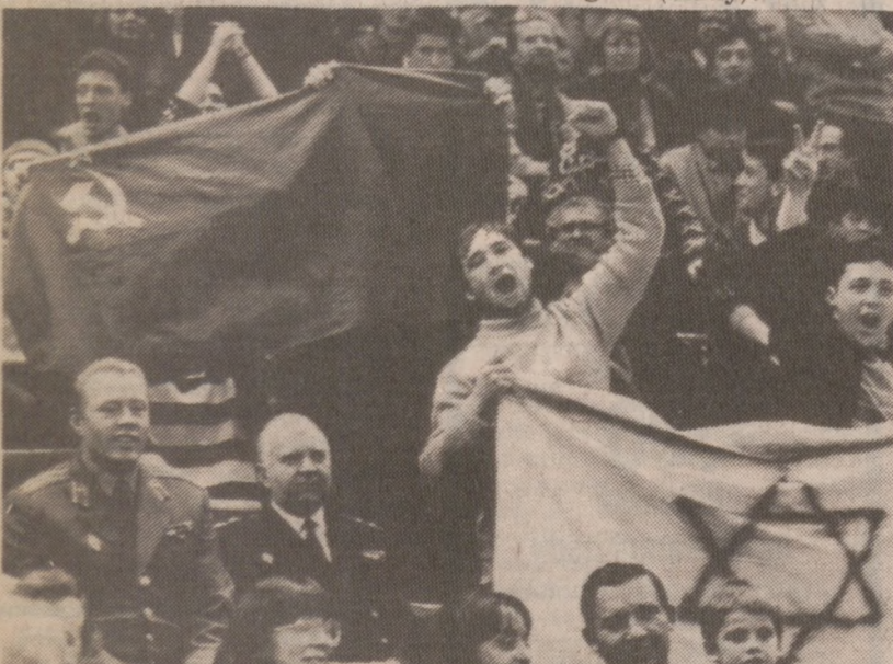
MOSKWA — W stolicy ZSSR odbył się mecz koszykówki między miejscowym zespołem CSKA Moskwa a drużyną Maccabi Tel Awiw. Na zdjęciu, kibice obu drużyn zachęcają do walki swych ulubieńców.