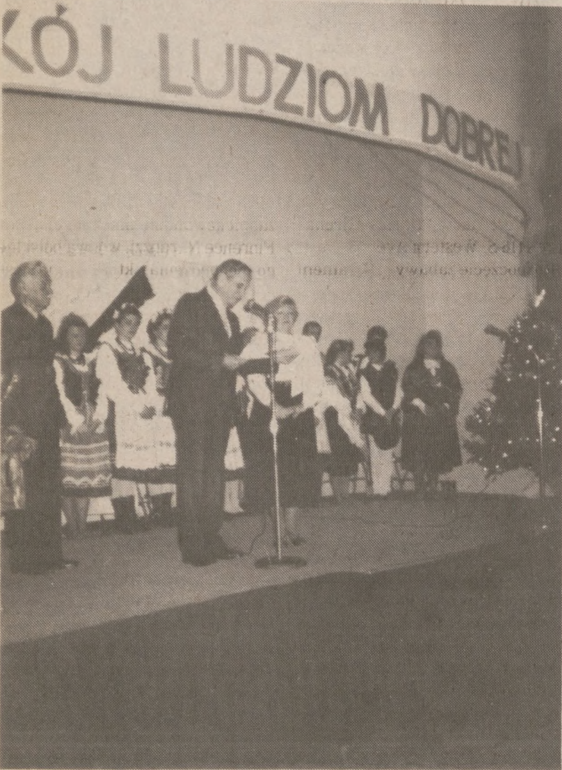
Wręczenie dyplomu Krzyża Zasługi.