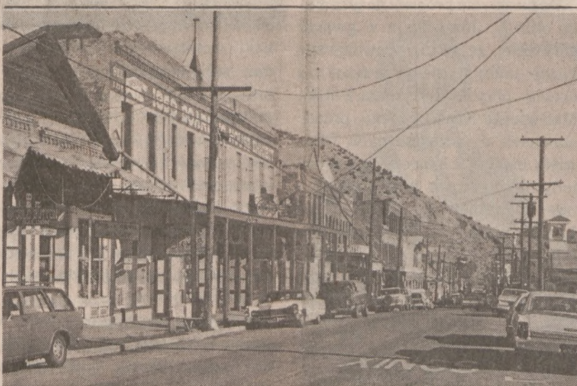
VIRGINIA CITY, NEVADA. — Zabytkowa ulica miasta zwana "C" Street.

Propozycja ta już spotkała się z protestem ze strony Stowarzyszenia Studentów USA. Przedstawiciele Stowarzyszenia twierdzą, iż finansowa pomoc studentów nie może być marchewką, która zmusi ich do pójścia do wojska. (ak)