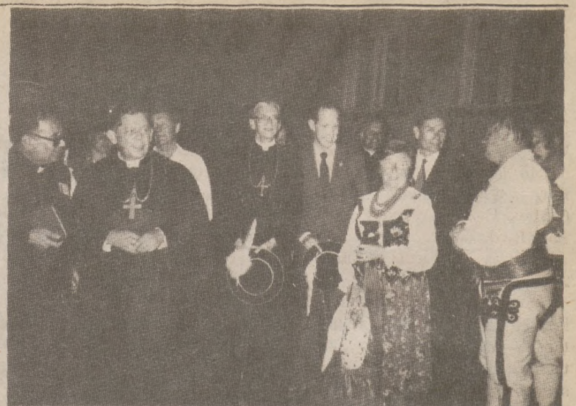
W ogrodzie plebanijnym mieliśmy okazję wręczyć kapelusze i ciupagi naszym dostojnym członkom honorowym. mu przez Prymasa Tysiąclecia ks. kard. Stefana Wyszyńskiego w asy-ście ks. kard. Karola Wojtyły — ukochanego naszego Papieża.