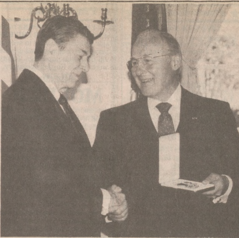
WASHINGTON — Podczas ceremonii w Białym Domu prezydent, R. Reagan uhonorował kon. Roberta Michela z Illinois "Prezydenckim Medalem Obywatelskim".