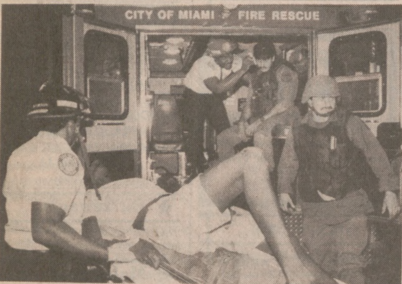
MIAMI. — Przez dwie noce w Miami trwały zamieszki murzyńskie. Na zdjęciu, jeden z postrzelonych uczestników zamieszek odwożony jest do szpitala, podczas gdy w ambulansie lekarz opatruje rany odniesione przez policjanta.

Sobota, 21 stycznia 1988 07 23 31 34 38 45