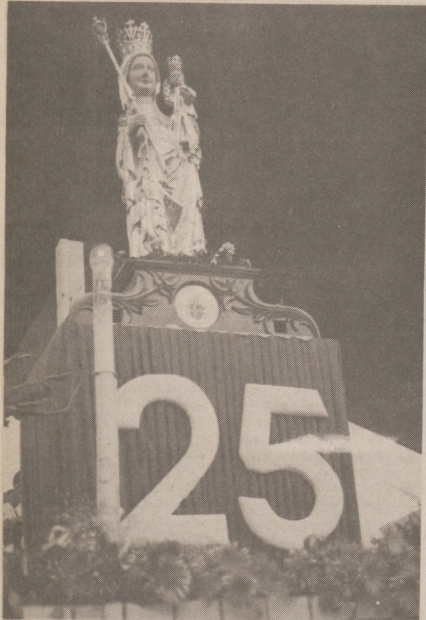
Nad wszystkimi czuwała nasza uśmiechnięta "Gaździna Podhala" z Dzieciatkiem w złotych koronach.