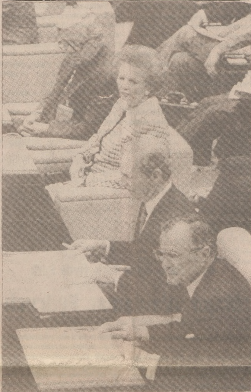
BRUKSELA — W Brukseli trwają obrady przywódców państw NATO. Na zdjęciu, prezydent George Bush, sekretarz stanu James Baker, premier Wlk. Brytanii Margaret Thatcher oraz brytyjski minister spraw zagranicznych sir Geoffrey Howe.