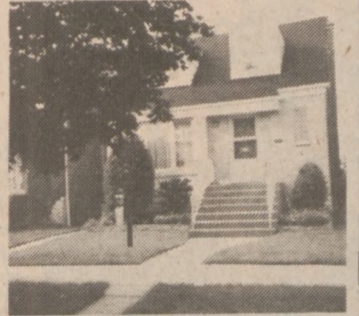
6134 S. ARTESIAN