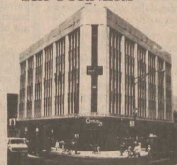
Milwaukee, Irving & Cicero