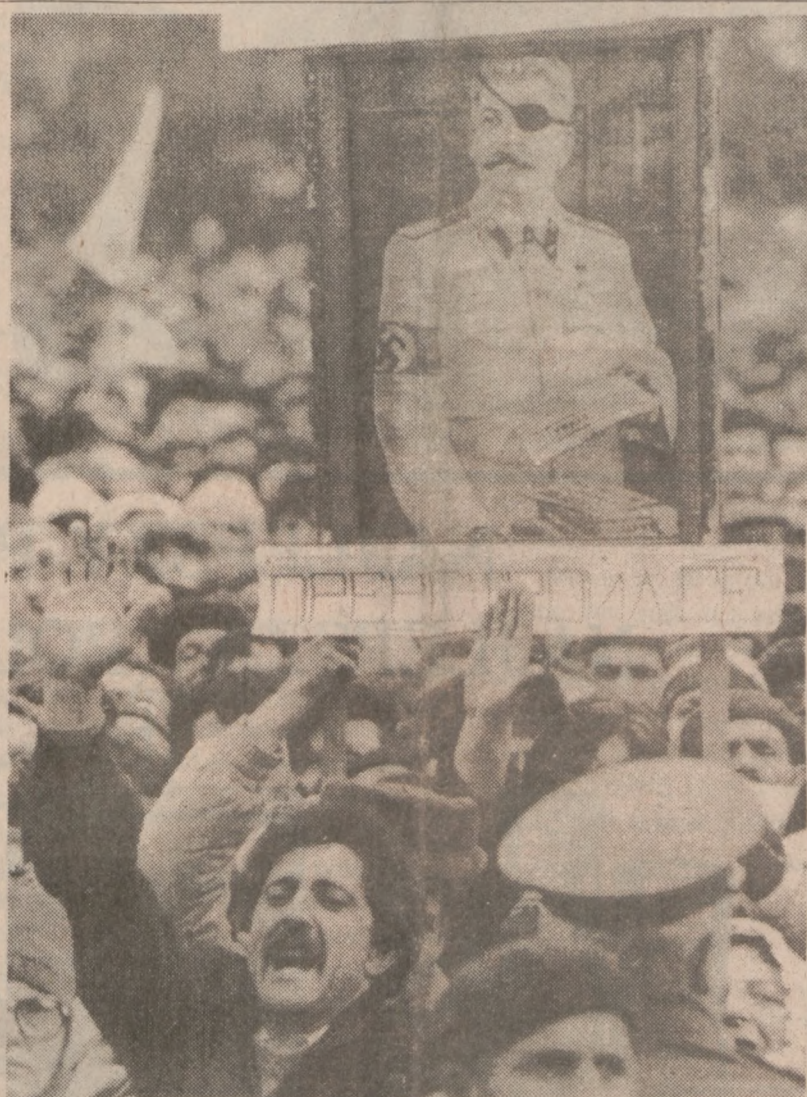
Uczestnicy prodemokratycznego wiecu w Sofii, który zgromadził ponad 50 tysięcy zwolenników Związku Sił Demokratycznych, niosą wizerunek Stalina ze swastyką na rękawie.

Porozumienie z MFW ze strony polskiej podpisze minister finansów, Leszek Balcerowicz. (eg)