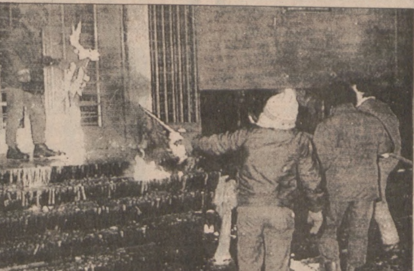
W osmą rocznicę wprowadzenia stanu wojennego młodzież obłata czerwona farbą i podpaliła siedzibę komunistycznej partii w Katowicach. Na terenie całej Polski zawył syreny fabryczne a robotnicy uczcili pamięć tragicznych chwil minutą ciszy.