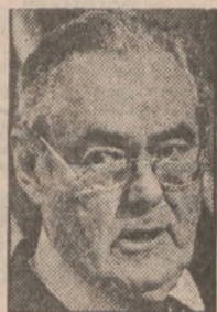
George W. Dunne

Przewodniczący Rady Powiatu Cook George Dunne po raz ostatni w swojej 21-letniej karierze politycznej przedstawił propozycję budżetu powiatowego na rok 1990 w wysokości $1.68 mld.