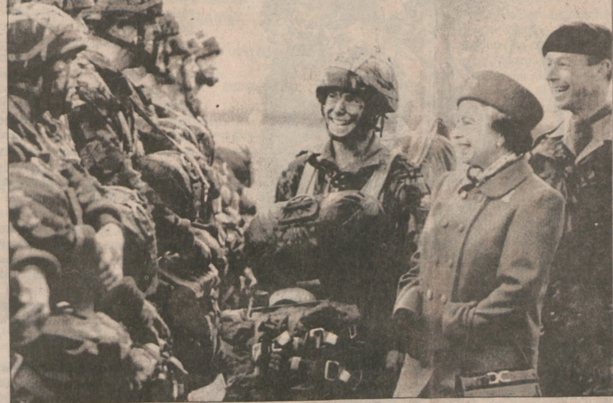
Tradycje wojskowe członków brytyjskiej rodziny królewskiej są nierozdzielnie związane z Royal Navy. Ale mimo to, królowa Elżbieta II wśród swych licznych obowiązków towarzysko-reprezentacyjnych znajduje czas na odwiedzanie nie tylko baz morskich i rozmowy z oficerami marynarki wojennej ale także na wizytowanie oddziałów lądowych lub sił powietrznych armii Zjednoczonego Królestwa. Na zdjęciu monarchini w towarzyskiej pogawędce z żołnierzami wchodzącymi w skład doborowej jednostki spadochroniarzy. Spotkanie odbyło się na błoniach przylegających do słynnej XI-wiecznej królewskiej posiadłości w Windsor pod Londynem.

W dzisiejszym numerze znajdziesz: * L. Gawlikowski — Jeszcze o wizycie premiera T. Mazowieckiego w Moskwie (str. 3) * Kronika Podhalan (str. 2) * "Noc generała" (str. 3) * Wiadomości sportowe (str. 4) * Ogłoszenia organizacyjne (str. 5) * Upamiętnić czyn niepodległościowy Polaków (str. 3) * Szlachetne zdrowie (str. 4)