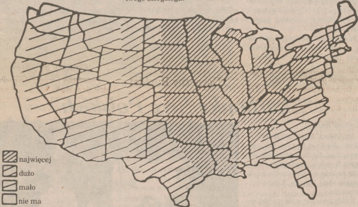
Rycina — Nasilenie zapylenia powietrza przez krostawiec (Ragweed) w USA.