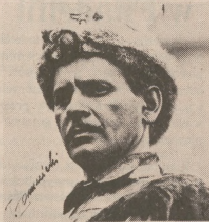
TADEUSZ ŁOMNICKI w filmie w tytułowej roli PAN WOŁODYJOWSKI

Doskonałym a zarazem interesującym pomysłem Jana Wojewódki było zebranie w jednym programie artystycznym doborowej grupy wybitnych indywidualności polskiego teatru, kabaretu, estrady, radia i telewizji, równocześnie gwiazd srebrnego ekranu. Artyści ci rozpoczęli już swoje występy w Kalifornii i już wkrótce wystąpią w innych większych skupiskach polonijnych w Stanach Zjednoczonych i Kanadzie.