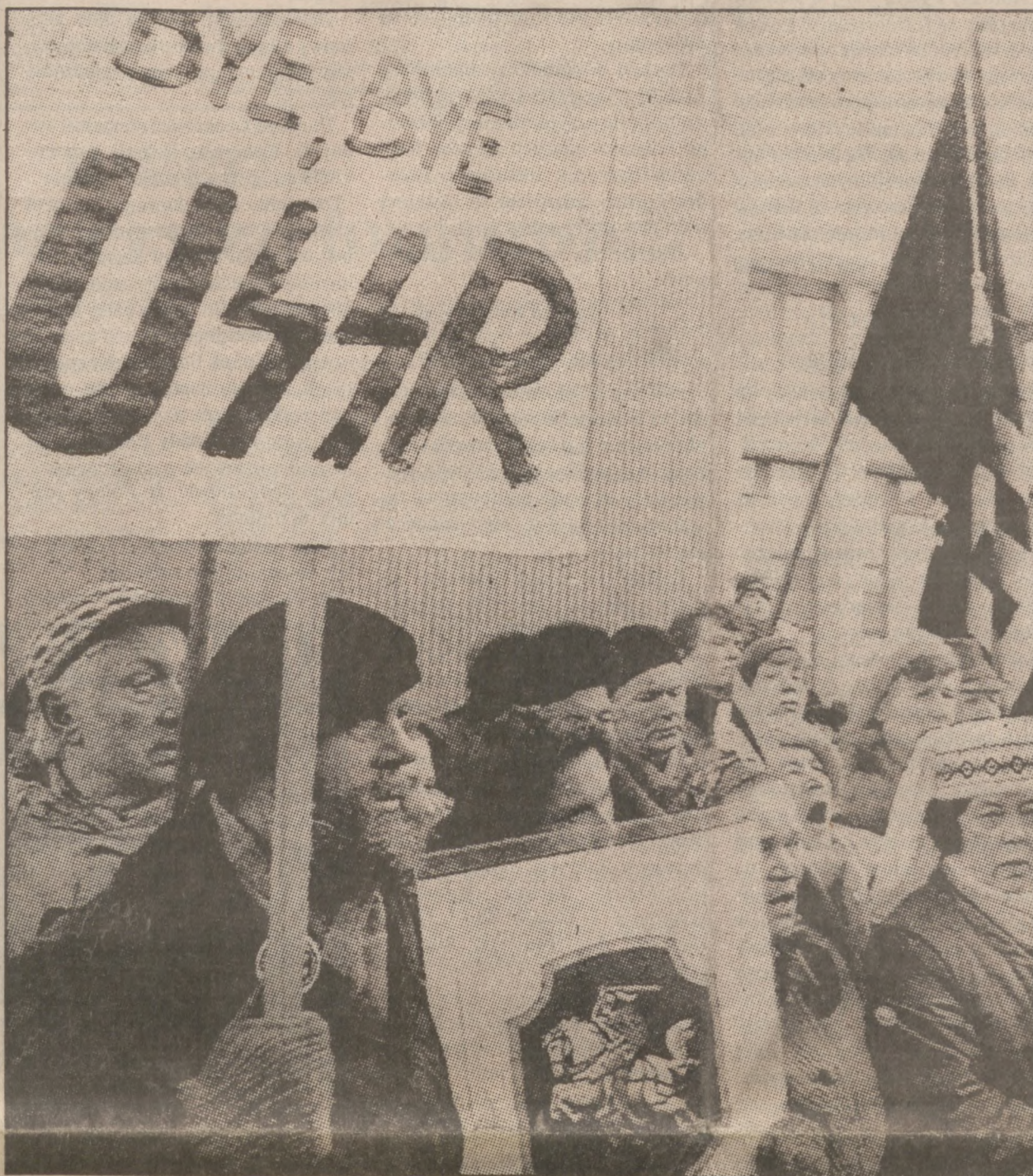
Litwini zebrani w niedzielę przed gmachem parlamentu w Wilnie z herbem litewskim — Pogonią i hasłem: "Żegnaj, ZSSR", oczekują na proklamowanie niepodległości.

Wilno (UPI, CT, CST) — W niedzielę wieczorem, po jednomyślnym głosowaniu w Radzie Najwyższej, Litwa ogłosiła niepodległość i wystąpienie ze Związku Sowieckiego.