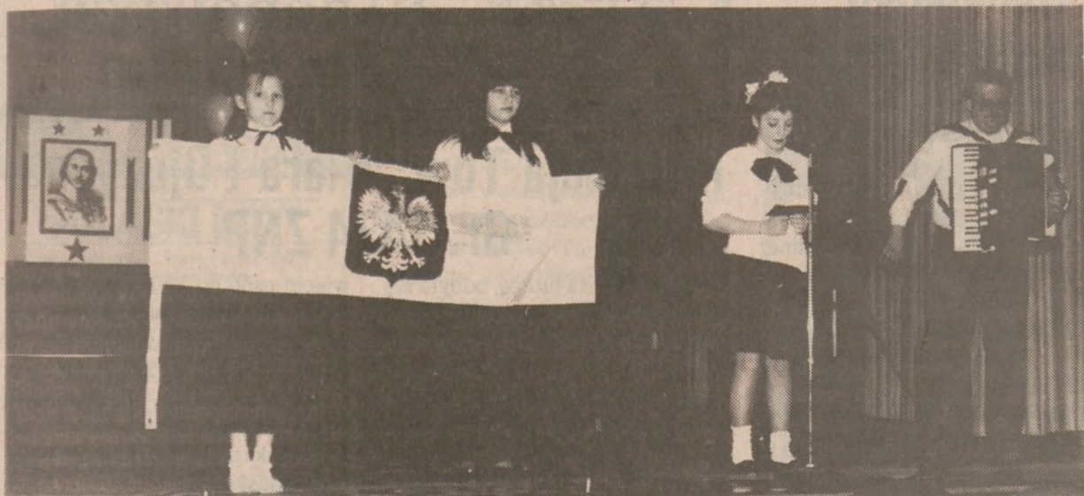
Spotkanie w Bibliotece Portage Cragin