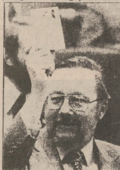
Nowo wybrany prezydent Litwy Vytautas Landsbergis: "Teraz Litwa jest wolna nie tylko w duszy, ale i w rzeczywistości".

Terytorium Litwy jest integralne i niepodzielne. Żadna konstytucja jakiegokolwiek innego państwa nie