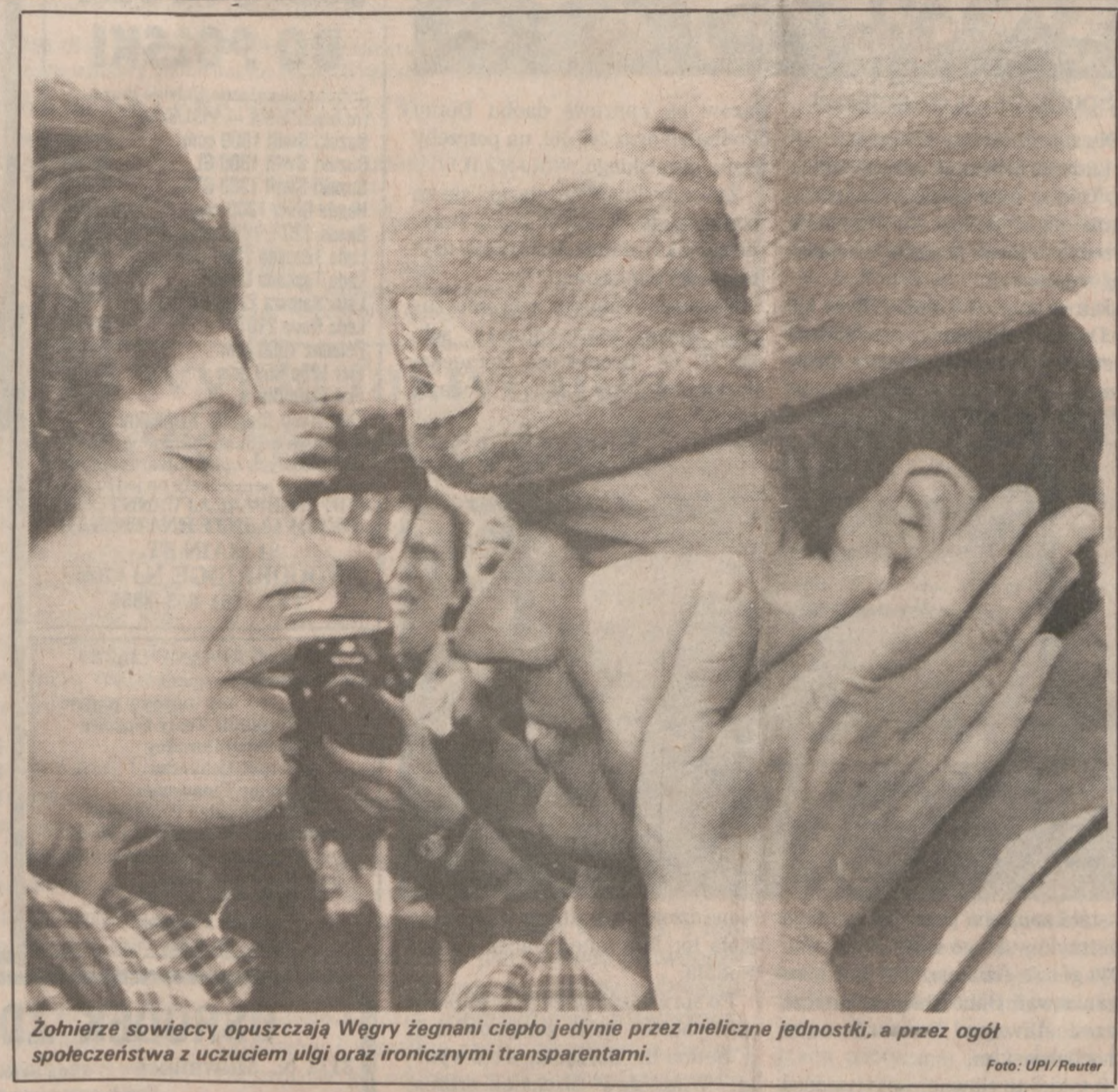
Żołnierze sowieccy opuszczają Węgry żegnani ciepło jedynie przez nieliczne jednostki, a przez ogół społeczeństwa z uczuciem ulgi oraz ironicznymi transparentami.