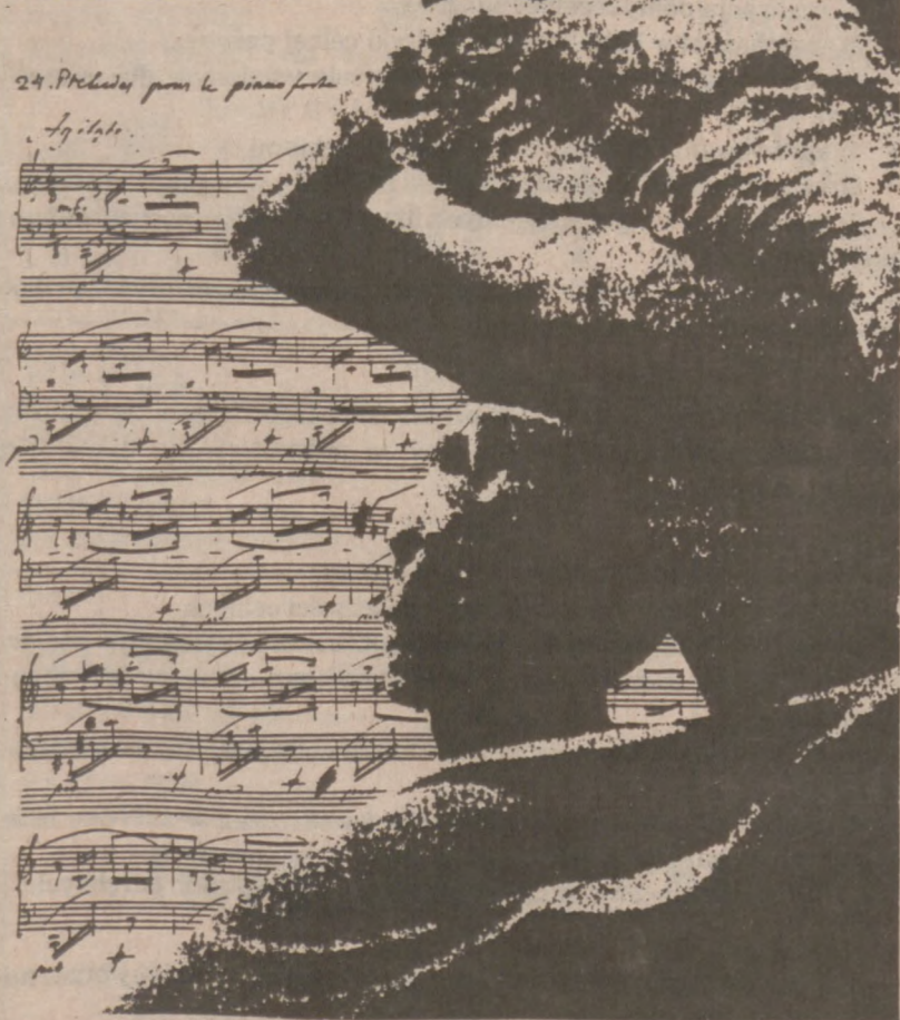
THE SEVENTH CHICAGO CHOPIN PIANO COMPETITION