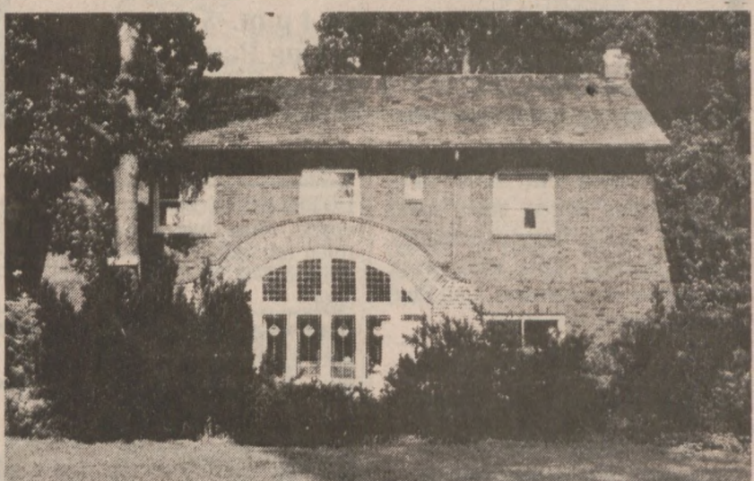
Dzielnica Longwood Drive, położona w zachodniej części miasta pomiędzy ulicami 98-mą i 110-tą zabudowana jest obszernymi rezydencjami stojącymi na dużych parcelach, stanowiącymi odbicie stylu życia przyjętego w ostatnich latach dziewiętnastego i początkach wieku dwudziestego.

Longwood Drive District była częścią miasteczka, które zaczęto budować wzdłuż stronnego brzozy. Architektura tej dzielnicy łączy w sobie różnorodność stylów popularnych w budownictwie lat 1870-1930.