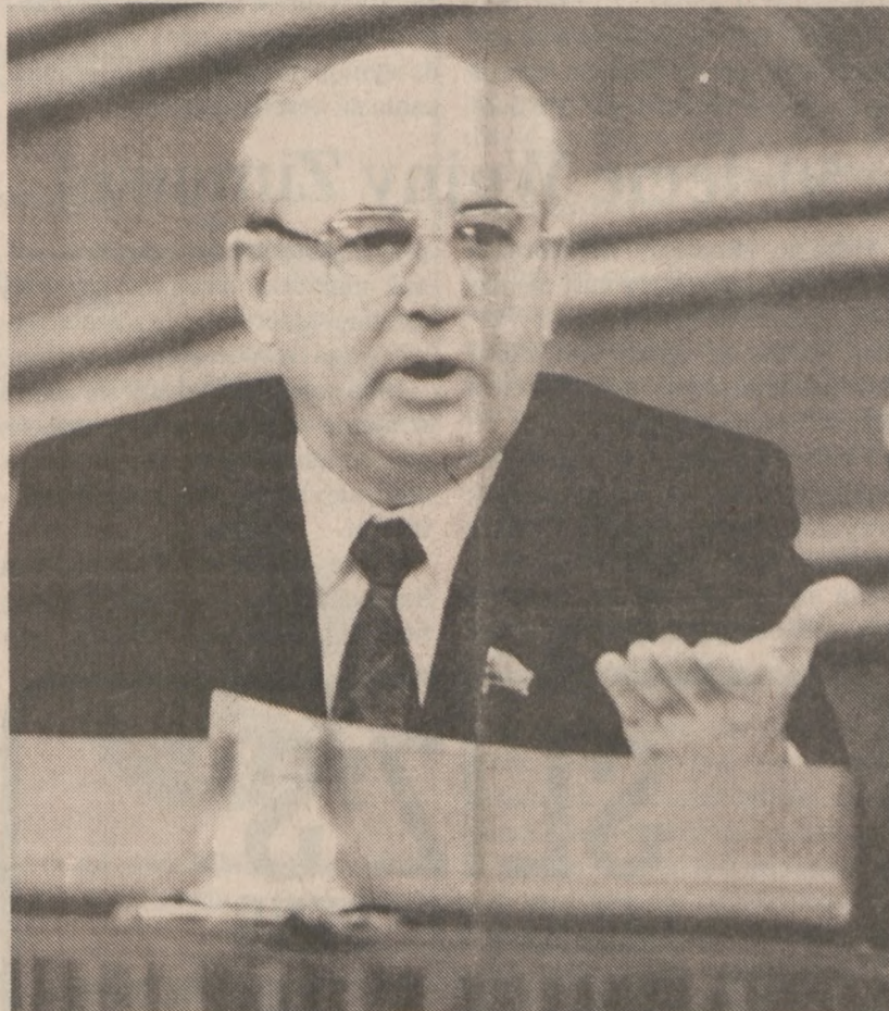
Michaił Gorbaczow został prezydentem ZSSR w wyniku wyborów, w których brał udział jako jedyny kandydat. W przemówieniu inauguracyjnym zapowiedział wykorzystanie swych szerokich uprawnień do przywróceniaładu w kraju i posuwania naprzód programu "pierestrojki".

Prezydent ma prawo do ogłoszenia stanu wyjątkowego, wysuwania weta wobec wniosków ustawodaw-