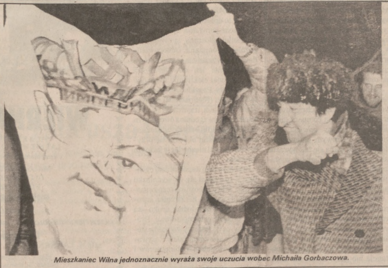
Mieszkaniec Wilna jednoznacznie wyraża swoje uczucia wobec Michaiła Gorbaczowa.

Duży napływ żydowskich emigrantów, którzy w wielu wypadkach są osiedlani na terenach okupowanych, wzbudza obawy Arabów.