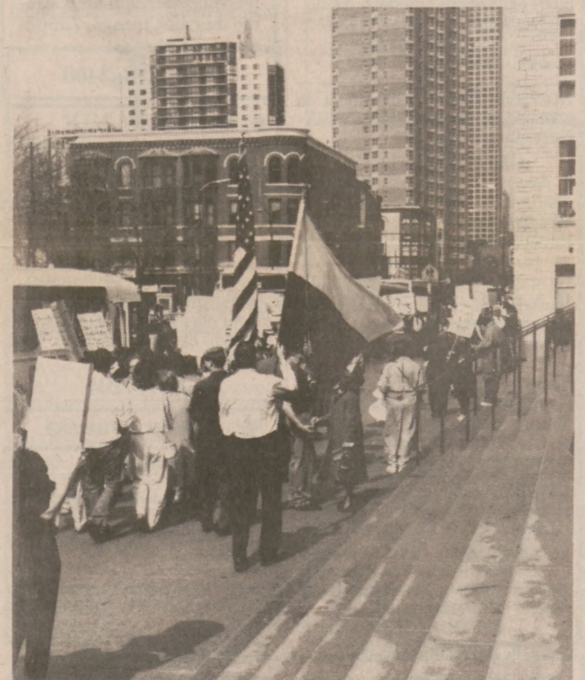
Parafianie kościoła Matki Boskiej Anielskiej co niedzielę pikietują Holy Name Cathedral w śródmieściu, 735 N. State Street. Od czasu powstania organizacji United Catholic Parishes, założonej przez dziesięć parafii zagrożonych zamknięciem, do akcji przyłączyły się inne grupy na znak protestu przeciwko arbitralnemu traktowaniu wiernych przez hierarchię kościelną archidiecezji chicagowskiej.