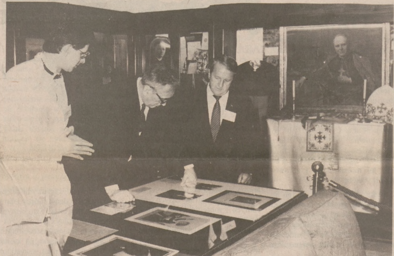
Sobota wieczorem — wizyta w Muzeum Polskim w Ameryce.

lonii amerykańskiej a mianowicie to, że oni tak bardzo jednocześnie chcą i są dobrymi Polakami i Amerykaninami. To jest pewien niezwykle fenomen. Bardzo ważny.