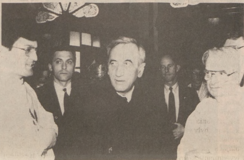
W kościele św. Jana Kantego.

Życzymy tobie panie Premierze Rzeczypospolitej Polskiej przede wszystkim dużo zdrowia, wytrwałości, zrozumienia przez naród i świat twoich szczerých wysiłków ku budowaniu lepszej przyszłości. Ży-