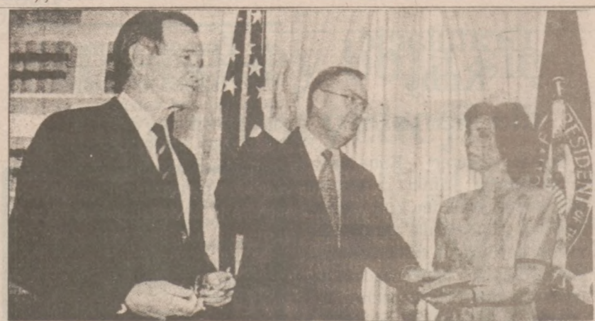
Gubernator Illinois James Thompson został zaprzysiężony w obecności prezydenta Busha na stanowisko "szpiega szpiegów" czyli prezesa Prezydenckiej Rady Kontroli Służ Wywiadowczych. Zadaniem Rady jest wykrywanie nielegalnych operacji agencji wywiadowczych. Gubernator Thompson sprawuje swój urząd w Illinois ostatnią kadencję i zamierzał od przyszłego roku odejść do prywatnej praktyki adwokackiej.

Dzwoniąc na podany wyżej numer można będzie uzyskać pomoc przy wypełnianiu formularzy i kwestionariuszy rozsyłanych przez Biuro Spisu Powszechnego. (ao)