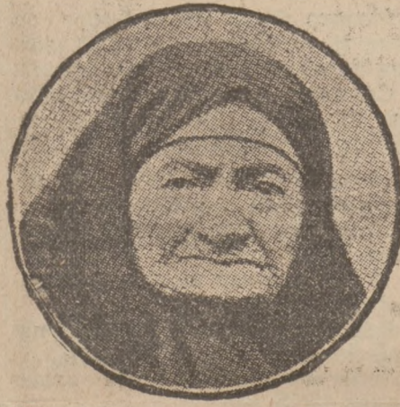
Ця Туркня має 164 роки і ще не думає вмирати.

Хоча старенький, але ще читає свою селянську газету „Політику“, і точно її передплачує. Він ще не вдовець, бо його жінка живе і має 102 роки.