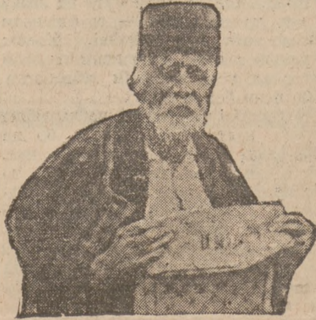
Цей сербський селянин має 110 літ і ще читає газету.

У нас, як доживе чоловік до 70 року життя, то кажуть, що досить пожив собі. Правда, трапляються по селах і старенькі діди або бабусі, що мають і по 90 літ, але таких дуже мало й дожити до їх вeku майже ніхто не надіється. Але в світі є люде, які дожили вже до сто літ, а деякі навіть перетягли далеко за сотку. Тут вичислимо