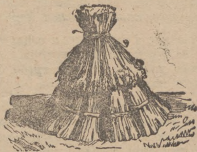
Снопи пшениці зложені в ляльку.

Житних снопів спирати так до себе не можна, бо вони задовгі і виверталисяби. Тому жито треба складати по кільканайцять снопів так як це видно на малюнку. Але в долині гузірі снопів не ппитискати до себе, тільки уставляти їх трохи вільніше, аби воздух міг продувати поміж них.