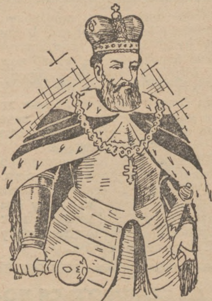
Князь Лев І.

ла, а саме: Шварно віддав дочку за литовського князя Войшелка і цей Войшелк згодом передав цілу Литву під владу Шварна, бо сам не чувся на силах володіти. Таким