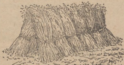
Овес, положений так, аби скоро сохнув.

Зовсім інакше складають хліб в снопах заграничні селяни. Там роблять це так, аби вони якнайскорше висохли і можна було швидко забрати з поля. Тому в багато заграничних краях зовсім не кладуть полукупків, лише опирають один сніп о другий так, як це видно на малюнку. Зложені так снопи сохнуть дуже скоро, бо з усіх сторін має до них доступ воздух і сонце. Передусім в слотисті літа показався цей спосіб дуже добрий, бо дощова вода спливає з колоса на діл і він дуже скоро висихає.