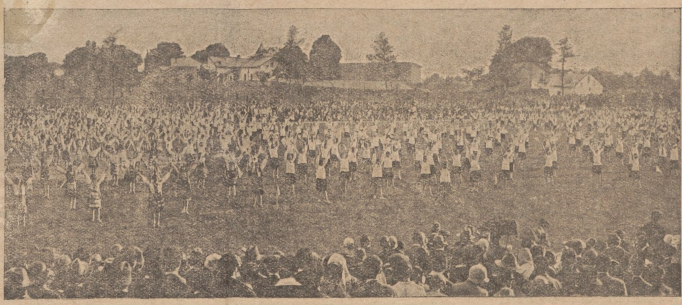
Ученики та учениці шкіл „Рідної Школи“ у Львові на „Святі Молоді“ в червні цього року. На тім Святі діти виступали з ріжними гімнастичними вправами.

А як цьому зарадити — питаєте. Так, як радять собі селяни в других краях. Там в кождім майже селі є діточа захоронка або діточий садок. Є це гарна громадська хата серед села, а коло неї пів до двох морги садку і город. В літі до тої хати зносять господині своїх дітей. Їх приймають одна або дві учительки чи сестри законниці, та опікуються тими дітьми через цілий день. Вони старших дівчаток заставляють, аби пообмивали, позачісували та нагодували менших дітей. Пізніше збирають всіх дітей разом та розказують їм байки і вчать, як вони дома мають родичів слухати, як мають шанувати старших. Стараються збридити їм крадіж, брехню, нехлюйство. Потім виводять дітей в сад та до городу