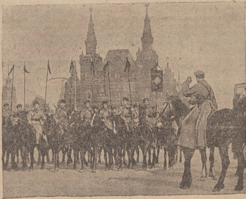
Большевики, хоч дуже бояться війни, але до неї таки добре приготовляються. На малюнку, видно, як на вулицях Москви генерал Буденний переводить перегляд кінноти перед її виїздом на китайсько-манджурську границю.