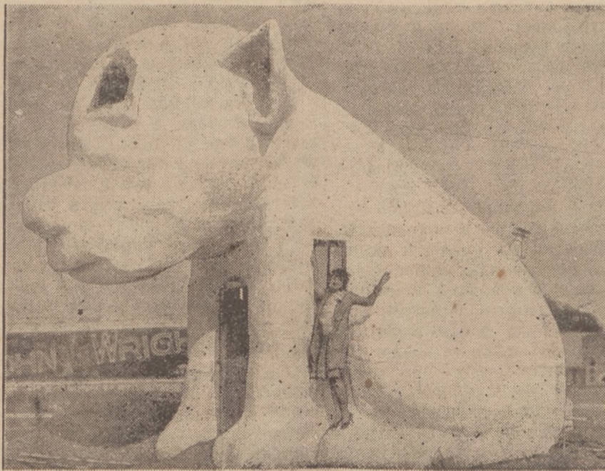
Це не є пес, хоч до пса подібне. Але є це такий дім, збудований у виді собаки. А збудували собі його кінові артисти в місті Голіуд, в Америці і пустили фотографію свого «собачого» дому в світ, аби всі люди дивувалися.