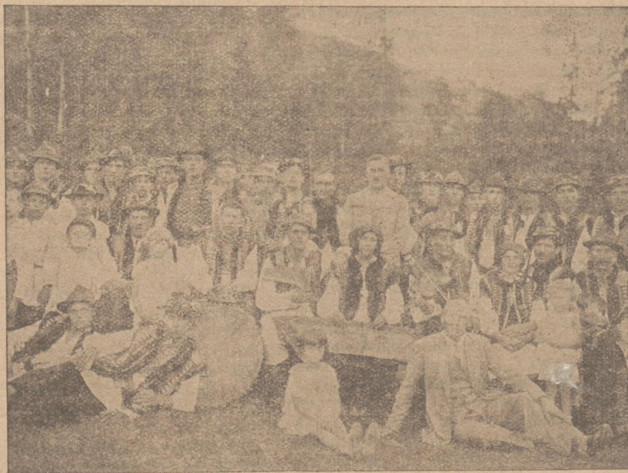
В неділю 21. липня був в Жабю великий фестин, з якого прибуток пішов на будову читальняного дому. На цім образку бачимо гуцулів, учасників фестину з музикою і з кількома місцевими інтелігентами.