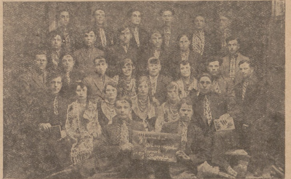
Тут бачимо Аматорський Гурток в селі Дорофіївці пов. Скалат.