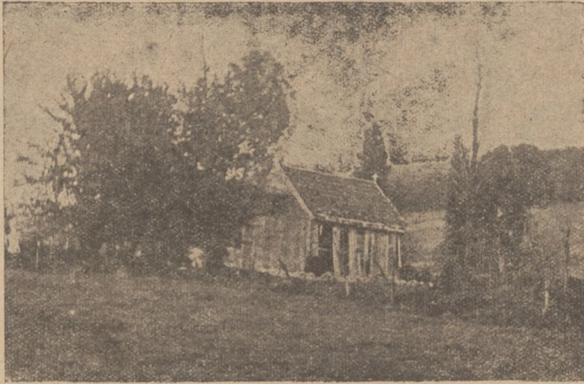
Це та зруйнована церков.

В 29 числі „Народньої Справи“ писалося про те, як то парохіяни села Севороги під Перемишлянами за одну ніч збудували собі церковцю. Ми думали, що всі правдиві християни без різниці віроісповідань, будуть раді, що, нині серед загального упадку релігійності і такого відсуття найшлися такі ревні люди, що з останнього стараються на будову церкви. Тим часом сталося інакше.