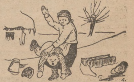
Та потім Петра вхопила, На коліно положила: „На, тепер ти будеш знати, Як на бабу уважати!“