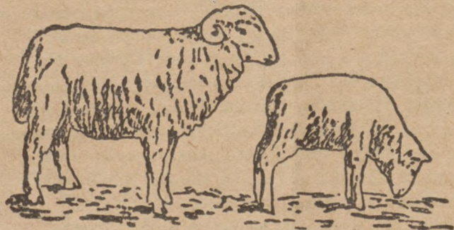
Так виглядає добрий баран

— Я не міг того знести, щоби мого приятеля хтось бив.