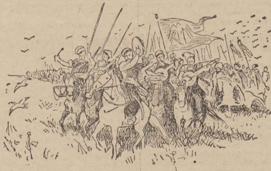
Хмельницький веде козаків і татар на польське військо (в р. 1648). По переду бачимо гетьмана зі старшиною і з козацькою музикою, що прекрасно виграла на бандурах і інших тодішніх інструментах а голос розходився по широких степах України.

Коли Хмельницький опинився з військом під Білою Церквою, розійшлася нагла вістка, що польський Володислав помер. Цєю смертю короля Хмельницький тішився, бо вона розв'язувала йому руки. Перед тим Хмельницький не мав такого розгону до Польщі, бо все думав і говорив, що король не є таким ворогом України і козацтва, як польська шляхта. Він і говорив, що з королем не воює, тільки зі шляхтою, з тими польськими старостами