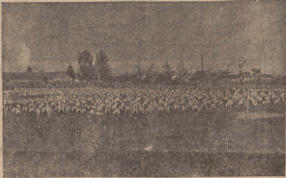
Це образок зі Свята Молоді шкіл „Рідної Школи“, яке відбулося в неділю 1. червня у Львові. Тут бачимо як вправляють сотки української дітвори.

До Румунії вернув 6. VI. князь Карло, погодився з жінкою і його проголосили румуни королем. (До-сі був королем його семилітний син Михайло.