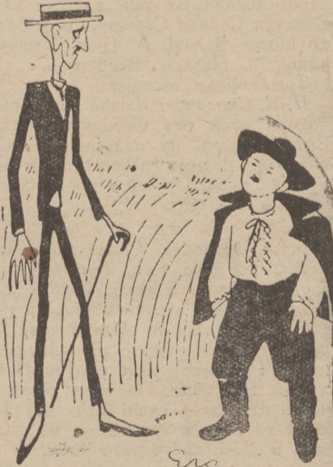
Читайте „Золотий Колос“ на стор. 176.