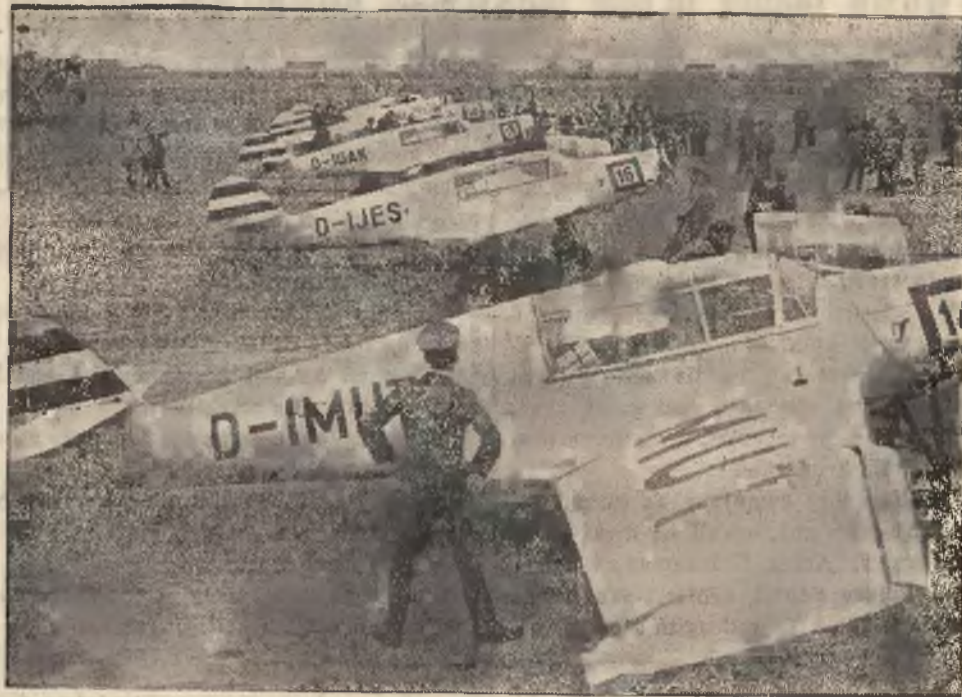
Samoloty niemieckiej ekipy challenge'owej.