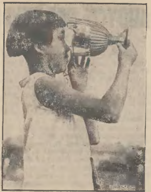
Trzynastoletnia Chinka, która ostatnio zwyciężyła w Anglii w zawodach tenisowych dla dziewcząt. Widzimy ją pijącą z pucharu, który zdobyła.