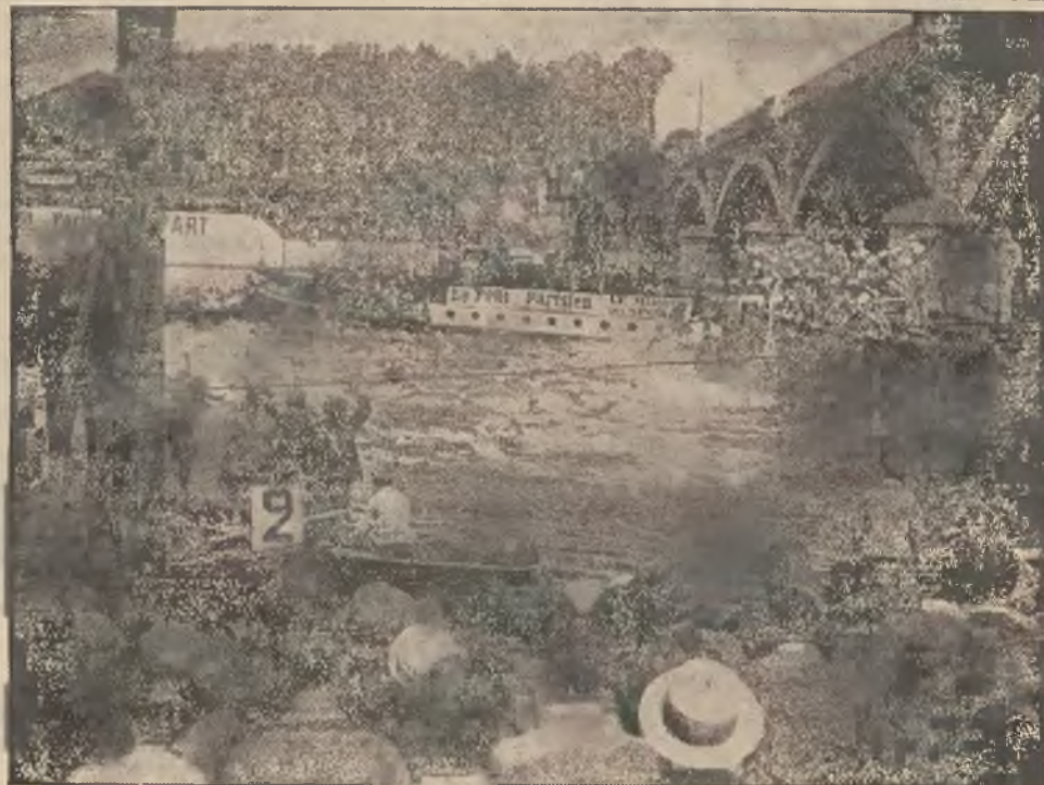
WPLAW PRZEZ PARYŻ

Tak więc czarni mieszkańcy Harlemu będą mogli i nadal dotykać się swego talizmanu.