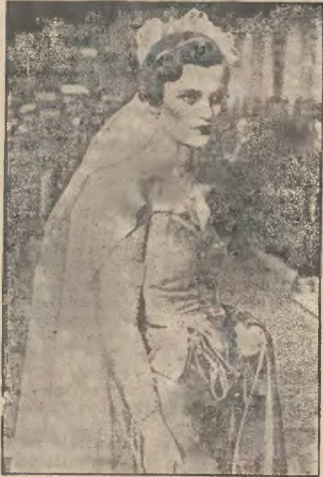
Strój dworski, w którym młoda osoba zobowiązana jest stanąć przed królem i królową angielską.