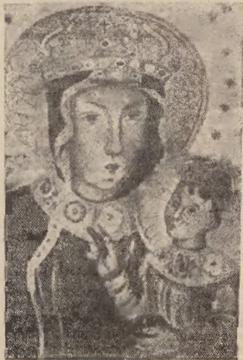
Cudowna Matka Boska Bocheńska

Obraz Matki Boskiej Bocheńskiej pędzla nieznanego artysty z XVI wieku, pochodzi z sąsiedniej Wieliczki, gdzie znajdował się początkowo w posiadaniu