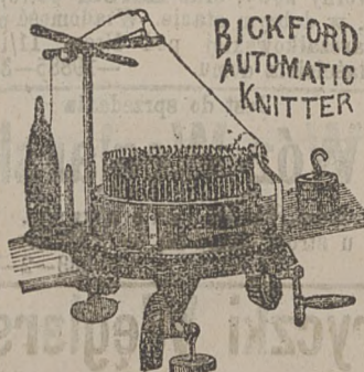
BICKFORD AUTOMATIC KNITTER

Ma honor zawiadomić, iż on sam tylko posiada wyłączną sprzedaż i agenturę słynnych maszyn do pończoch Amerykańskich Bickfordzkich , które w ostatnich czasach tyle sensacji zrobiły i uwagę tutejszej prasy na siebie zwróciły.