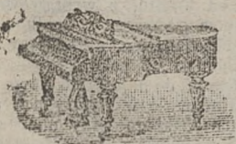
WARSZAWA Ulica Miodowa 10. wprost Sądu Okręgowego.