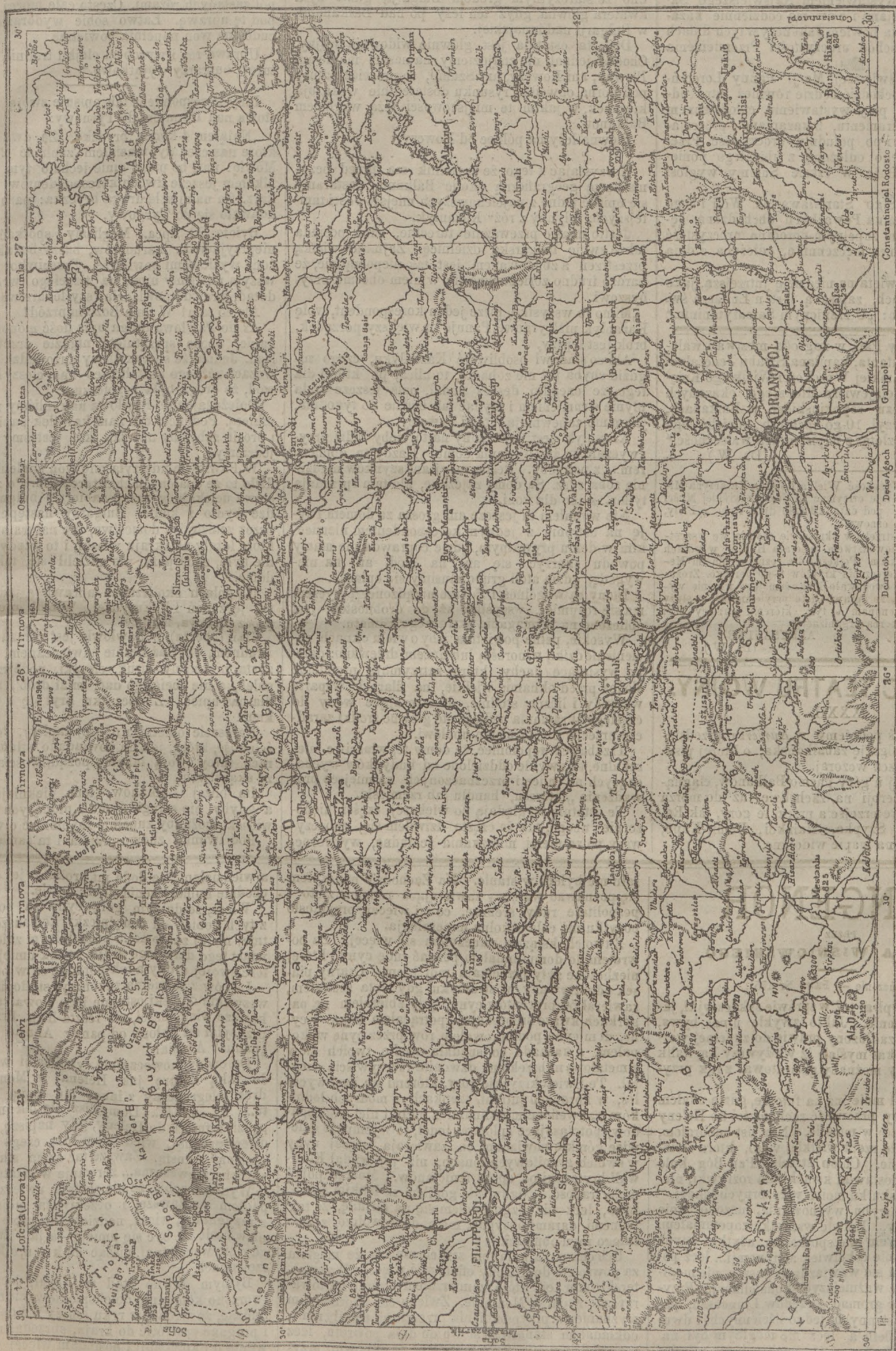
Karta teatru wojny na południowej stronie Bałkanów.

Redakcja otwarta od 11-ej rano do 2-giej po południu.