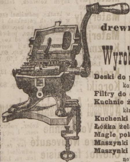
Maszynki do siekania mięsa.