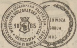
Dyplom pierwszej klasy