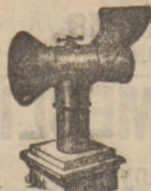
Wyciągacz zepsutego powietrza do kominów wentylacyjnych.