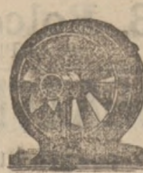
Wentylator szrubowy na ruch transmisyjny do wyciągania zepsutego powietrza, pyłu, pary, gazu itp. w różnych fabrykach.