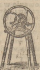
Pompa rojalacyjna do spirytusu, wina, piwa, wody itp.