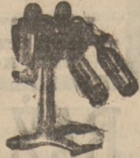
Maszyny do napełniania butelek.