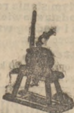
Pompa esy-lacyjna do piwa, wina, spirytusu, wody itp.