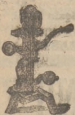
Korkownicę do butelek.

Fabryka wyrabia oprócz innych Maszyn, Kotłów, Urządzeń, Pomp itp., następujące przyrządy: