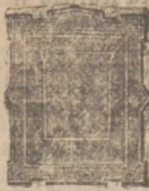
Wentylator pokojowy z wentylami mikowemi do kanałów dymowych.