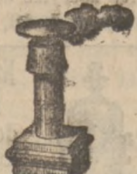
Wentylator kominowy, zapobiegający dymieniu pieców w mieszkaniach.