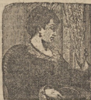
Dama w wieku 57 lat ODALISK

Odalisk, działanie tego cudownego środka oddziela stare pomarszczone atomy—plamy, pięgi zmarszczki ustępują, a skóra gruba, szorstką, martwą, zamienia na świeżą, białą i rumianą cerę zdrowia. Odalisk jest środek higieniczny, odmładzający i nie ma sobie równego i w ciągu 20 lat pozyskał uniwersalne uznanie.—Cena Odaliska rs. 2: Pudru rs. 1 kop. 50: do obydwóch na przesyłkę dołącza się kop. 50.