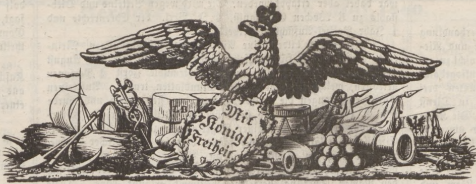
105. Jahrgang der „Privilegirten Stettiner Zeitung.“