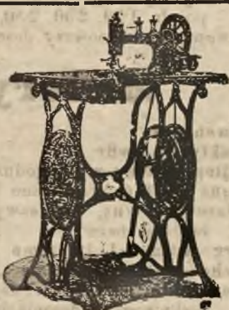
Maszyny do szycia Singera