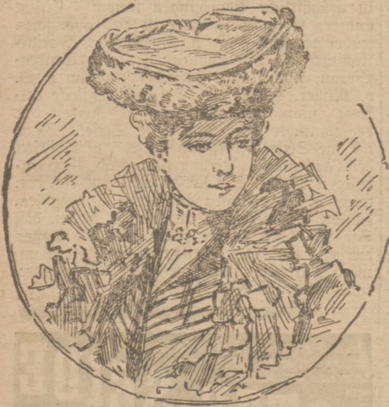
Skizze 1. Flacher Sammethut mit Federkranz.

Glockenärmel repräsentieren einen neuen Typ. Für englische Kostüme wählen die Schlände die mehr oder weniger kurze Sockade mit einem der neuen Schulter-, Kermel- oder Hals-Schritte (wie sie die „Modenwelt“ mit Abb. 35 der Nr. vom 1./8. 1901 darstellt). Sehr elegante Schneider-Kostüme erhalten neuenten außer einem berartigen Saft-Heberzieher auch noch eine ganz glatte Amazonen-Taille mit kleinem Kettfrack-Schößchen und außerdem einen kleinen Bolero, diesen zur beliebigen Ergänzung durch Manschetten und Jabots, so daß ein einziges solches Kostüm in einer gut neutralen Farbe tatsächlich jedem Zweck wie den wechselnden Temperaturen dienen kann.