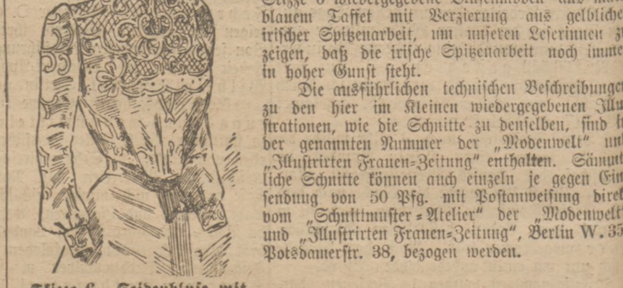
Skizze 6. Seidenbluse mit irischer Spitzenarbeit. Muster-Vorzeichnung auf Satin liefert das Schnittmuster-Meister der „Modenwelt“ für 2,50 Mark (3 Kr.).

Unter den interessantesten Handarbeiten, die die genannte Nummer bietet, wählten wir das mit Skizze 6 wiedergegebene Blusenmodell aus matter blauer Taffet mit Verzierung aus gelblicher irischer Spitzenarbeit, um unierten Leserinnen zu zeigen, daß die irische Spitzenarbeit noch immer in hoher Gunst steht.