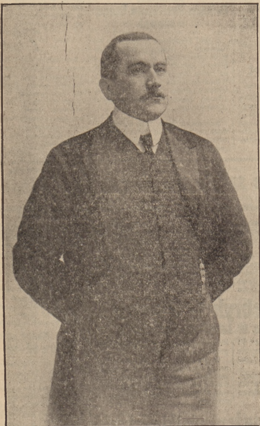
Roman Dmowski w roku 1909 (październik)