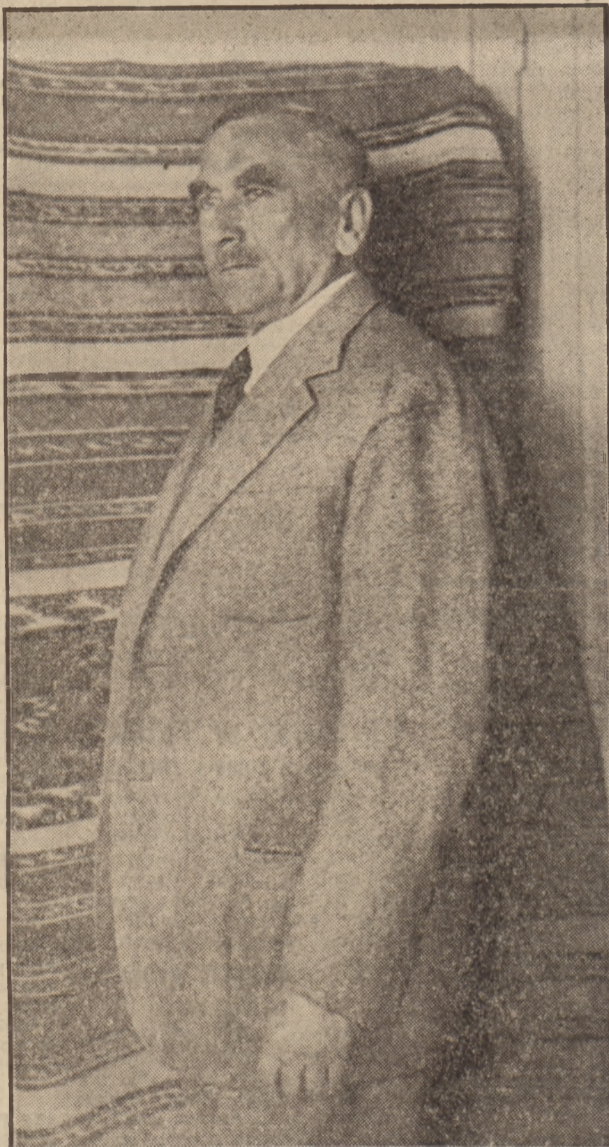
Roman Dmowski w Algierze w roku 1932