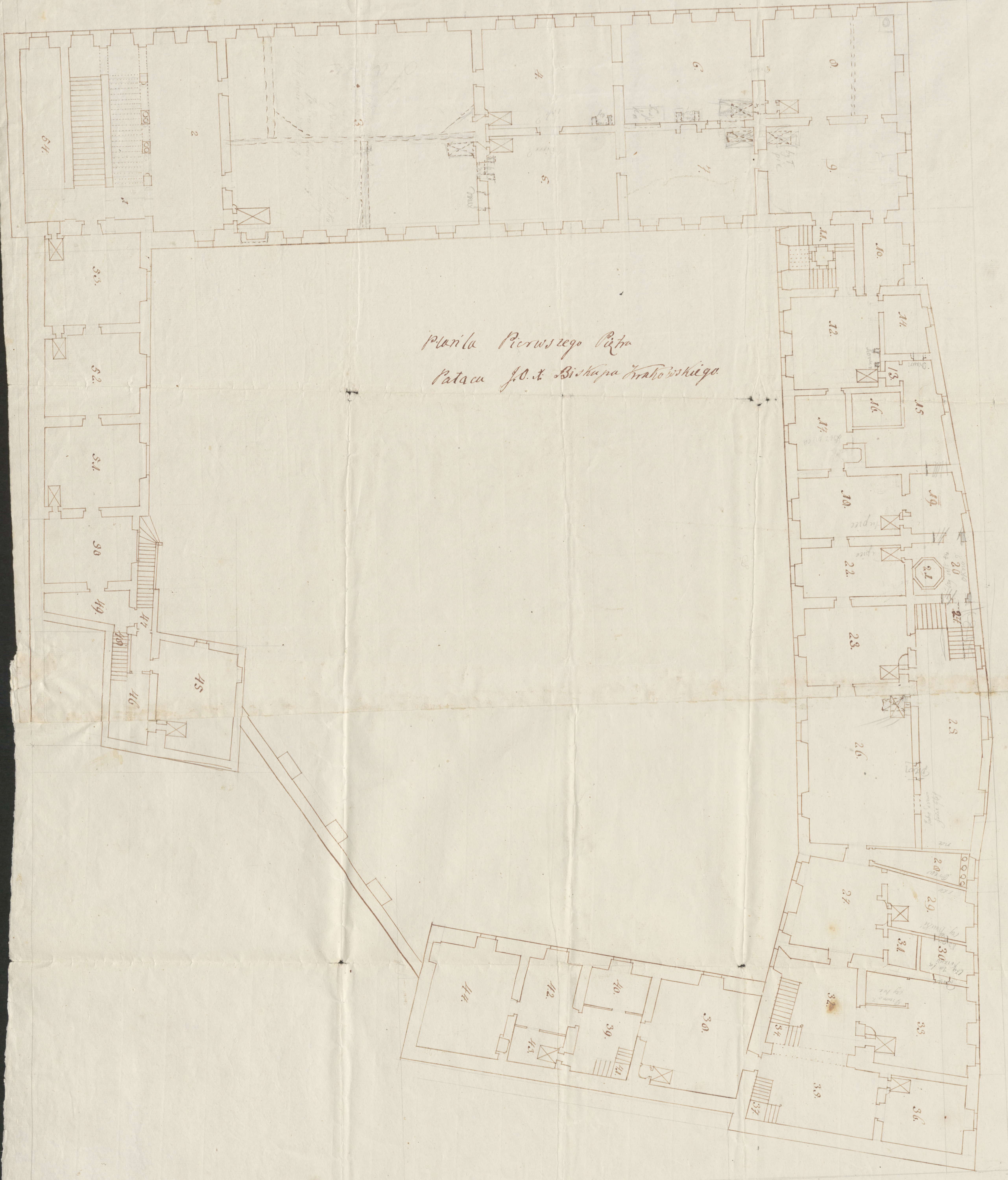
plan Pałacu Peruwskiego Pałacu J. O. S. Biskupa Krakowskiego