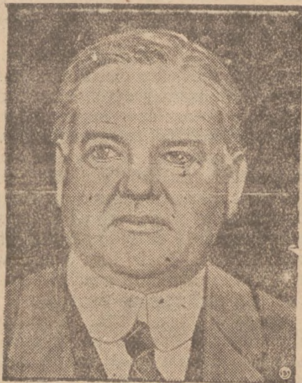
Herbert Clar Hoover.

urodził się 1874, z zawodu górnik, pracował w kopalniach w Ameryce, Australji i Chinach. W roku 1917 został zamianowany dyktatorem żywnościowym, a w roku 1921 sekretarzem stanu dla handlu i przemysłu.