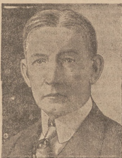
Charles, Gates Dawes.

urodził się 1874, z zawodu górnik, pracował w kopalniach w Ameryce, Australji i Chinach. W roku 1917 został zamianowany dyktatorem żywnościowym, a w roku 1921 sekretarzem stanu dla handlu i przemysłu.