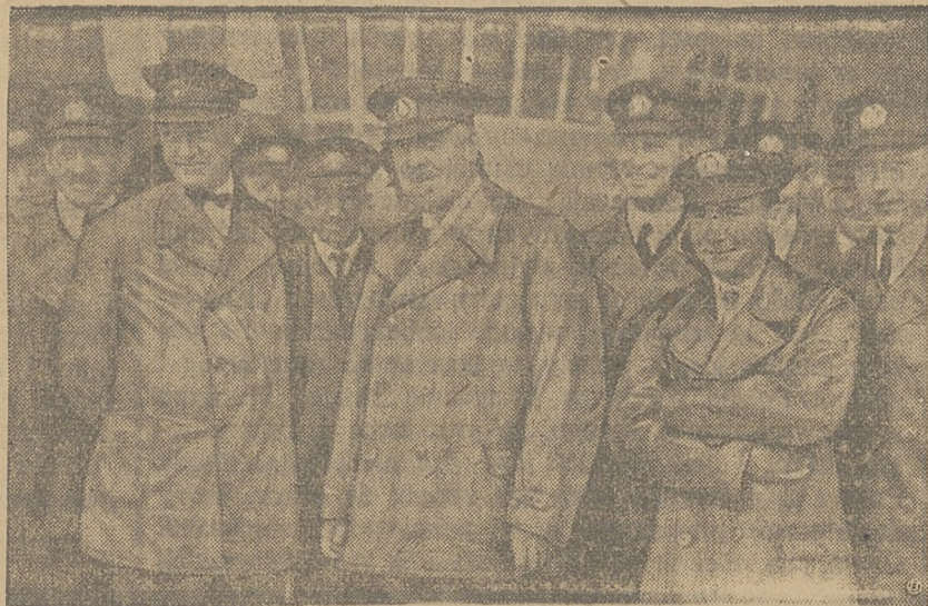
dr. Eckener ze swoją załogą.

Dopiero o godz. 5 po południu wydania Ullsteina i Huggenberga podały doniesienia, że Zeppelin o godz. 3 po południu według czasu europejskiego znalazł się nad przylądkiem Hatteras, t. zn. nad wybrzeżem amerykańskim. Jednocześnie Biuro Wolffa podaje, że o godz. 3.45 według czasu środkowo-europejskiego dostrzeżono sterowiec nad Cape Charles w stanie Wirginia. Biuro Wolffa podaje, że przybycia Zeppelina do Lakehurst spodziewają się w Ameryce około północy według czasu środkowo-europejskiego.