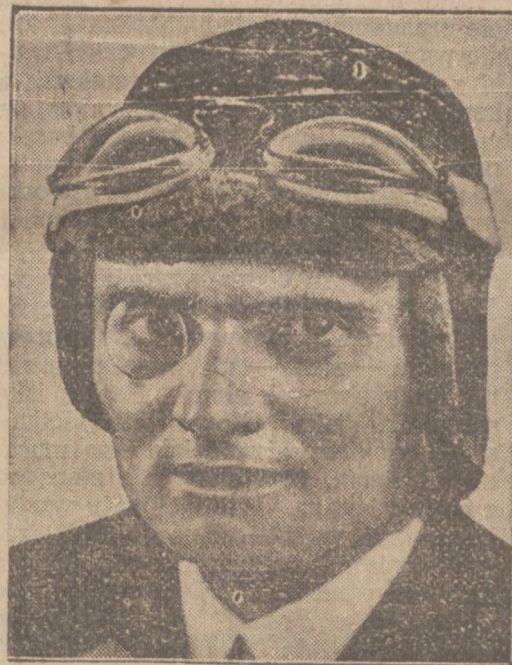
Zgon lotnika transatlantyckiego von Hühnefeld'a.

Przodujące sfery wychodźstwa naszego, prócz rozwijanej wśród rodaków akcji organizacyjnej i propagandowej na rzecz Wystawy, bardzo usilnie zabiegają o to, aby na czas Powszechnej Wystawy Krajowej ścignąć do Polski jak największą ilość obywateli danego państwa, którzy po zaznajomieniu się ze zdolnościami twórczymi narodu polskiego, przez szeregienie wśród swego otoczenia prawdy o Polsce, przyczynią się do obalenia fałszywych, często krzywdzących nas, opinii szerzonych zagranicą.