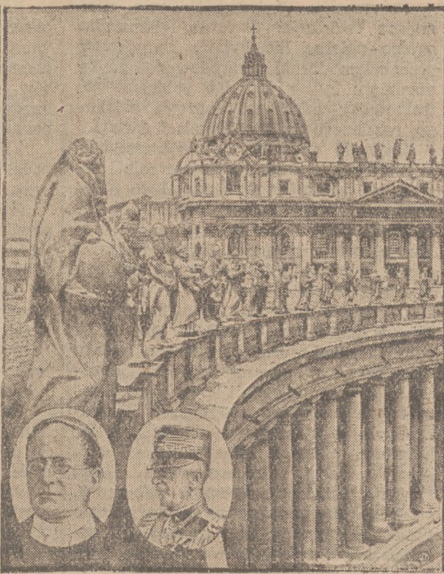
4. Wiktor Emanuel, król włoski.