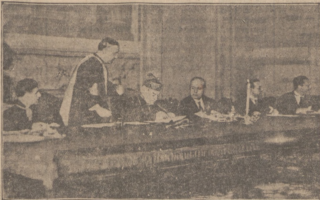
Sala papieska w Lateranie. Sekretarz stanu Stolicy Apostolskiej kardynał Gasparri w imieniu Papieża Piusa XI i Mussolini w imieniu rządu królestwa włoskiego kładą swe podpisy pod ugode rzymską.