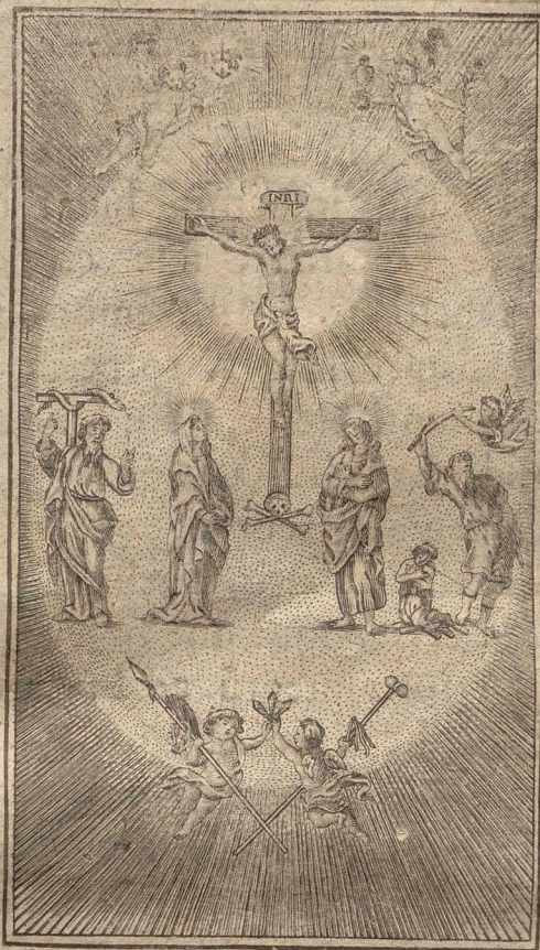
Paulus Josephus Tondirzeowski. sculp.

Nunc autem in CHRISTO IESU, vos qui longe eratis aliquando, facti estis propè in Sanguine CHRISTI. Ipse enim est Pax nostra, qui fecit utraque unū. Ephes. 2.