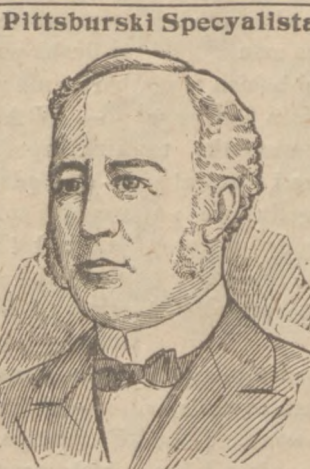
Nie biorę zapłaty jeżeli nie wyleczę.

mezkich lecz od razu i ze skutki usuwam bezpowrotnie.