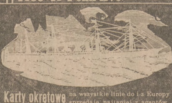
Karty okrętowe na wszystkie linie do i z Europy sprzedają najtaniej z agentów.

Telefony: Bell 281 Grant — P. & A. 1297 Main