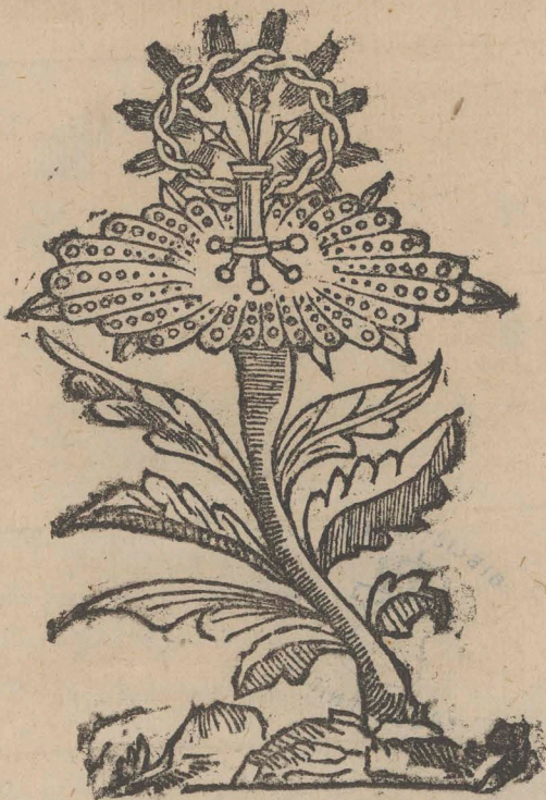
Granadilla, cuius descriptio est initio Poematis.